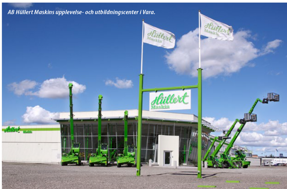
AB Hüllert Maskins upplevelse- och utbildningscenter i Vara.

I Vara finns också ett unikt upplevelsecenter , med utställnings- och utbildningslokaler samt ett övningsfält för demonstrationer och körutbildning med Merlo. Syftet med centret är att ytterligare stärka kontakten med maskinägarna inom rentalentreprenad- och jordbrukssektorerna. Alla ska kunna få uppleva flexibiliteten med teleskoplastare! Ingenting slår att själv provköra en Merlo och det ska vara lätt att få göra det. Samtidigt fungerar centret som utbildningsplats för att ta teleskoplastarkort. ■