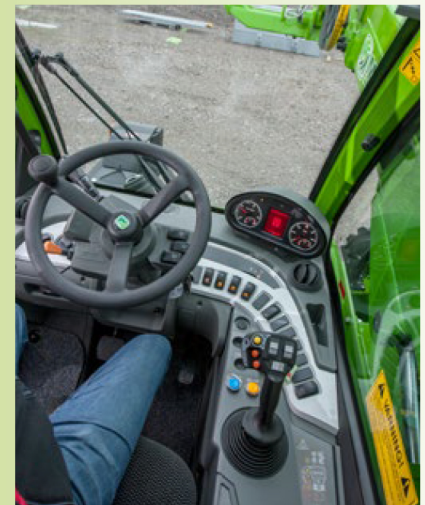
Den nya modellen har ny layout på reglage och instrumentpanel.

Den större 45.11:an är betydligt större i formatet och ger därmed också mer lyftkapacitet och lyfthöjd på 11 meter. Här är specifikationerna för de två maskinerna: